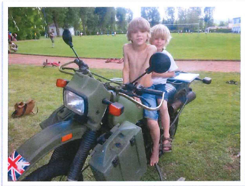
Technikgeschichte zum Angreifen - die HD 350mt am ESV Sommerfest