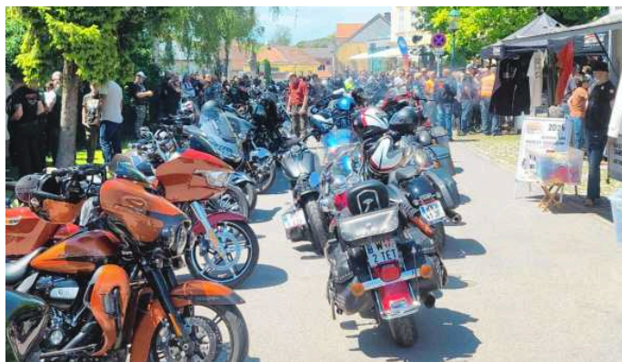
▲ Über 250 Harleys machten Halt in Göttlesbrunn